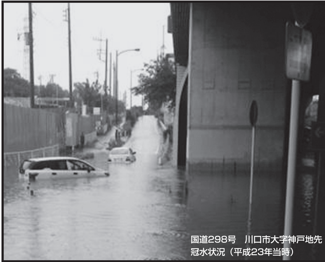
国道298号 川口市大字神戸地先 冠水状況（平成23年当時）