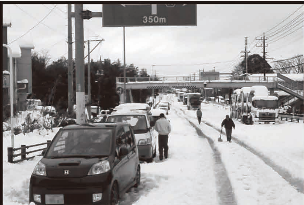
大雪により立ち往生した車 平成26年2月 国道16号入間市高倉地区

■ 冬の道路は積雪や路面の凍結など、天候により状況が刻々と変わります。普段雪の少ない平野部でも大雪になることがあります。 車を運転する際は最新の気象情報の確認 をお願いします。